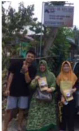
Gambar 2 Lokasi Mitra

Mitra kegiatan pengabdian ini berada di Desa Penarungan, Mengwi, Kabupaten Badung. Tim Pengusul telah mengadakan kunjungan awal untuk mengetahui keberadaan mitra, produksi yang telah dilakukan, kendala-kendala yang dialami selama mengelola usaha serta harapan atau target yang ingin dicapai untuk usahanya. Keberadaan dan lokasi mitra dapat dilihat pada Gambar 2. dan Gambar 3. Lokasi mitra dengan Kampus STIKOM Bali berjarak kurang lebih 22 km dan dapat ditempuh kurang lebih 38 – 46 menit dengan berkendara kendaraan roda empat.