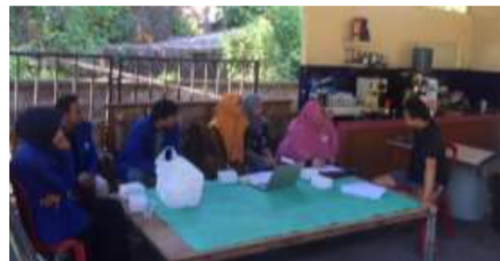
Gambar 5 Pelatihan Akuntansi

Gambar 5 menunjukkan pelaksanaan kegiatan pelatihan. Kegiatan juga dilakukan dengan memberikan form buku kas ke mitra. Mitra mengisi catatan penjualan yang telah dilakukan. Tim Pengusul memberikan beberapa form buku kas dalam binder yang dapat digunakan oleh mitra untuk melakukan pencatatan keuangan usahanya.