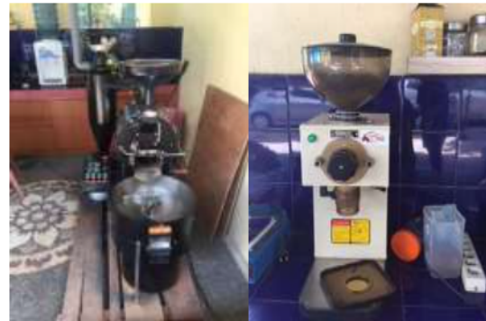
Gambar 1 Peralatan Produksi Kopi

produk mitra. Sedangkan produk grade 2 telah dikemas menggunakan bahan kertas.