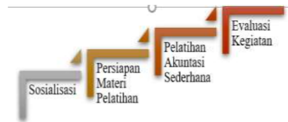
Gambar 4 Tahap Kegiatan Pengabdian

kegiatan pengabdian ditunjukkan pada Gambar 4.